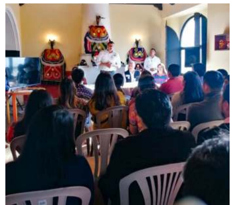
Reunión con el Parlamento de la Niñez, Adolescencia y Juventud Indígena.