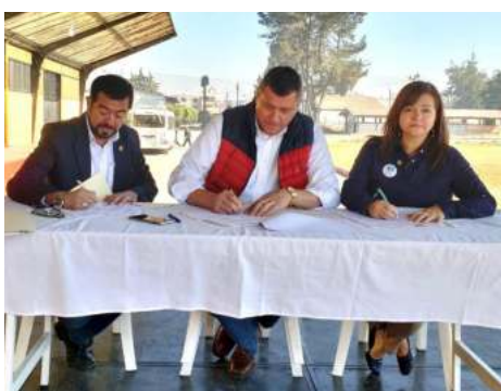
Firma de Convenio dentro de la Gran Cruzada por la Nutrición, entre ANAM y SESAN.