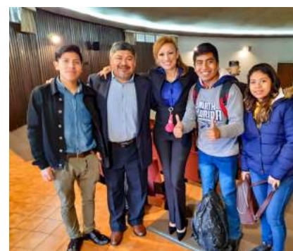
Estudiantes que participan en EPSUM.