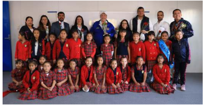
Inauguración del Módulo para niños de Primaria de la Escuela "Francisco Estrada" de Salcajá.