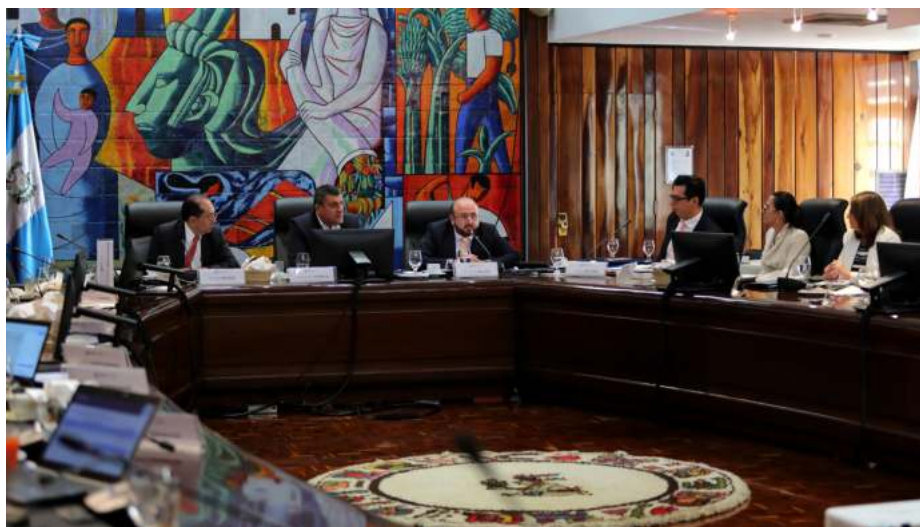
Integrantes del Gabinete Económico.