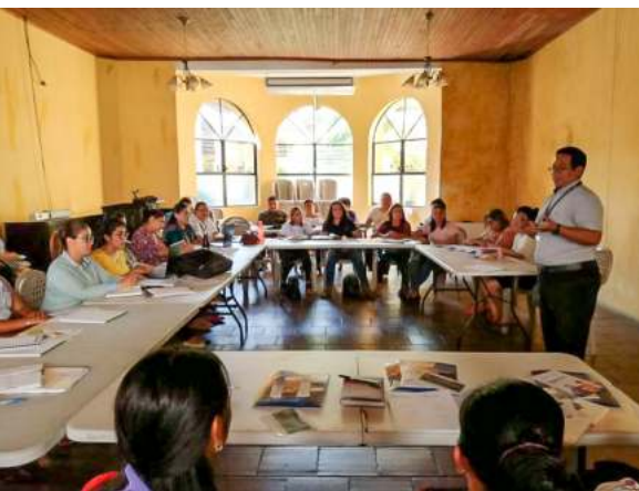
Reunión de RED-VET en Suchitepéquez.

Por otra parte, en Totonicapán, con la asistencia de funcionarios relacionados con el tema de la Violencia Sexual, Explotación y Trata de personas y con el objetivo de fortalecer la coordinación interinstitucional y prevenir los delitos VET en el departamento, también se realizó una reunión con dichos sectores. Similar reunión se realizó en Santa Rosa, en donde se aprobó la Política Pública contra la violencia 2019-2029.