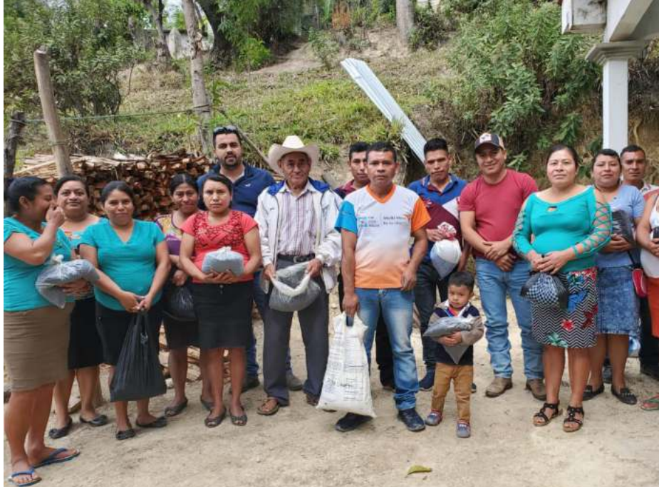
Familias beneficiarias de San Juan Ermita, Chiquimula.