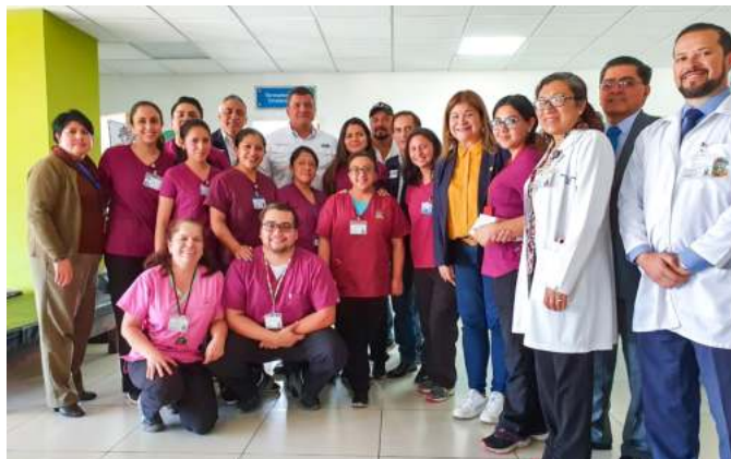
Visita a las instalaciones del IGSS, le acompañan médicos, enfermeras y miembros del personal administrativo.