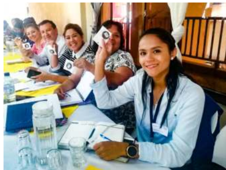
En Santa Rosa se aprobó la política pública contra la violencia.

Y, en Jutiapa también se brindó información a importantes sectores, sobre la Política Pública contra la Violencia Sexual en Guatemala durante los años 2019-2029. Similar reunión se realizó con el mismo tema en Santa Rosa.