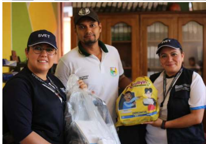
Entrega de información en Ayutla, San Marcos.

En Ayutla, San Marcos, se entregó este importante material a Bomberos Voluntarios y a Policía Nacional, Cruz Roja y se les mostró la prevención de los ciberdelitos a través de la realidad aumentada. Además, se hizo entrega del material en puntos estratégicos, para prevenir los delitos VET.